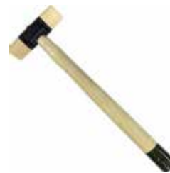
プラスチックハンマー または銅ハンマー